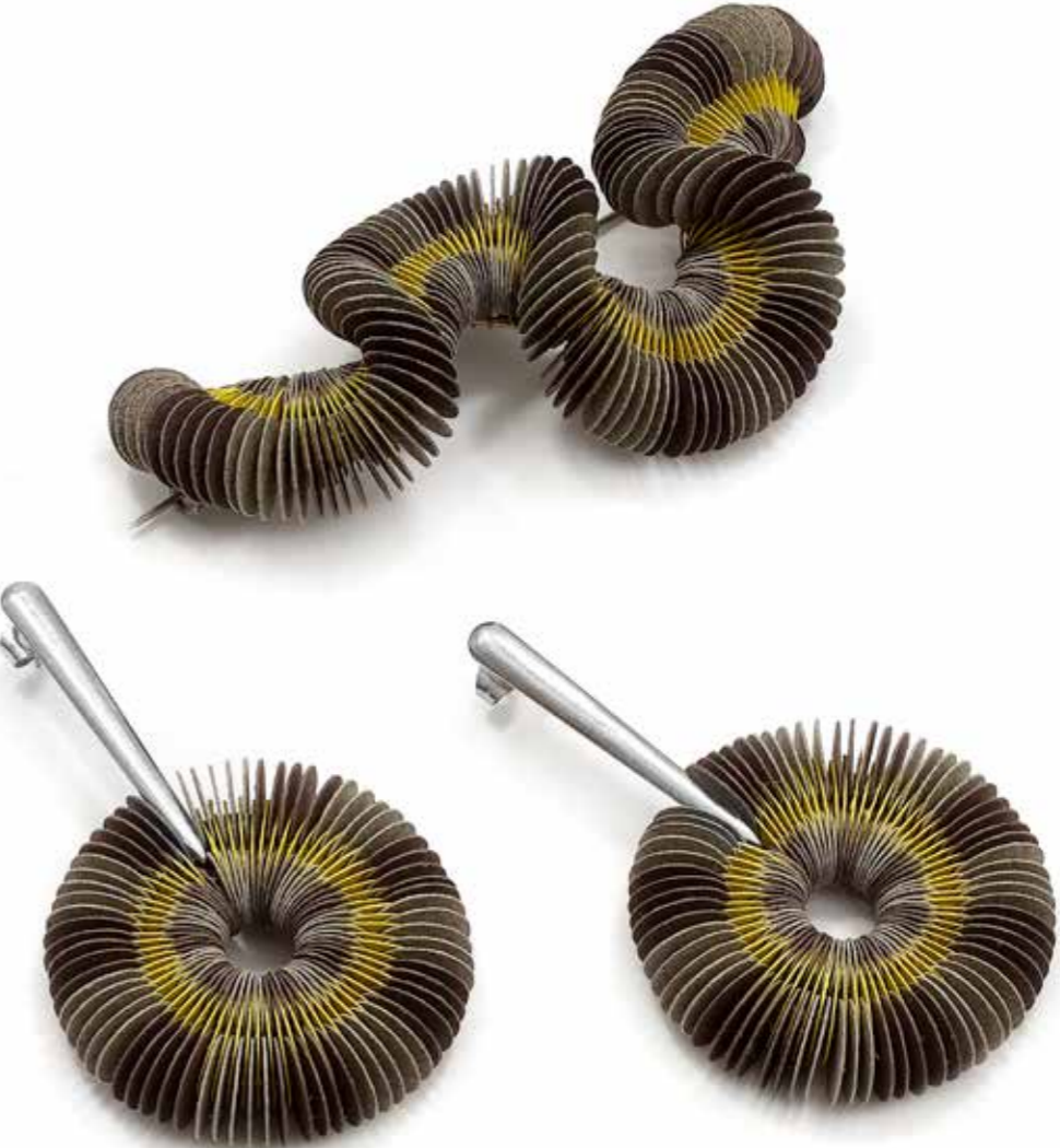
● Papierowy wąż Brosza karton, stal nierdzewna 3 x 5 x 10 cm 2024

The Diversity of Paper poses questions about what we consider valuable and on what terms. Observing the nature of transformation and the versatility of paper - which may be both waste and a work of art, at times yielding morphic forms, at other times industrial ones, or structures inspired by origami - we look, as though into a mirror, at our own perspective: the simple can appear complex, while the complex may prove surprisingly simple.