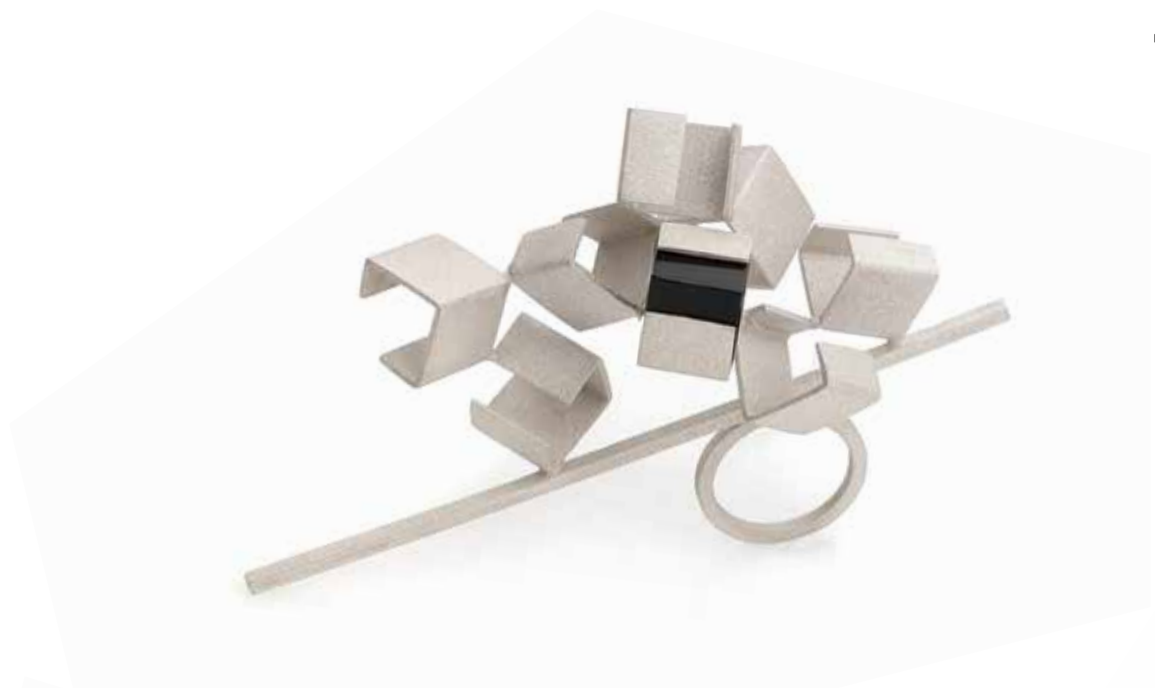
Floto rings, silver 950, 2023