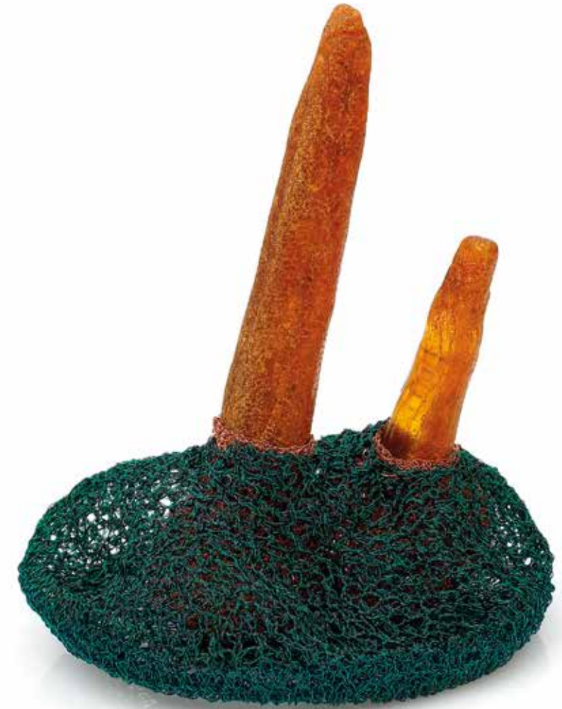
Klatka / Schron

brosza, miedź, srebro, stal, bursztyn, 2023