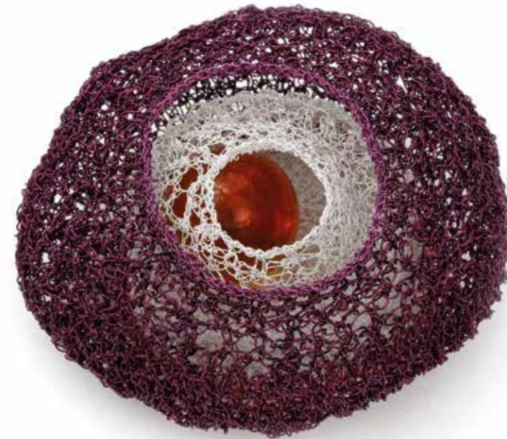
Social anxiety / Comfort zone brooch, copper, silver, steel, 2023