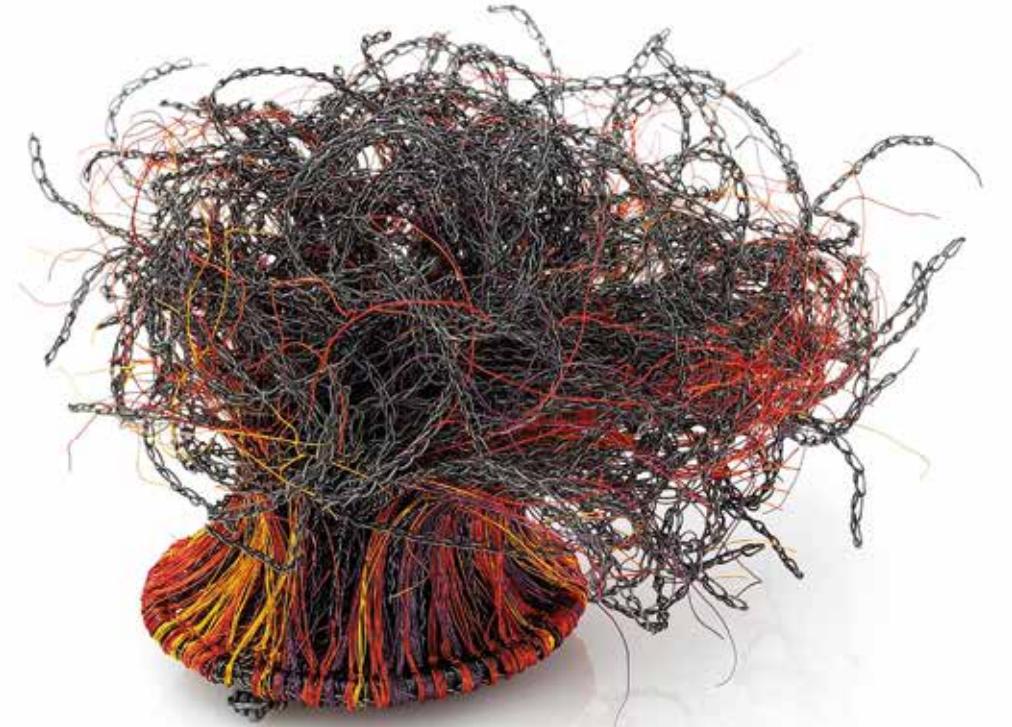
Mania / Kreatywność brosza, miedź, srebro, stal, 2023