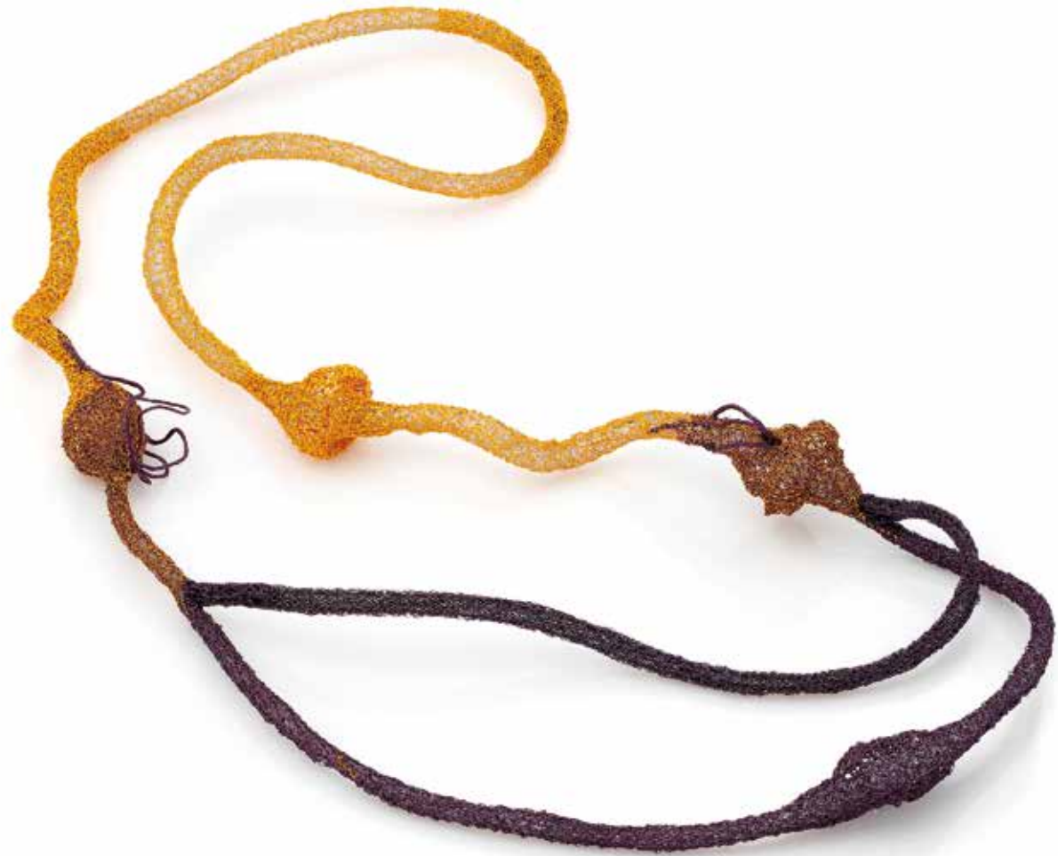
Pasożytnictwo / Symbioza naszyjnik, miedź, silikon, stal, 2023