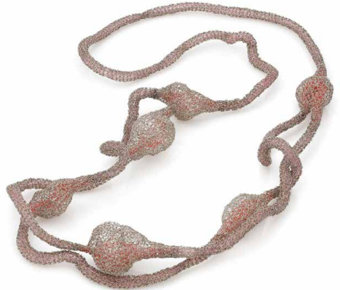
Parasitism / Symbiosis necklace, copper, silicon, steel, 2023