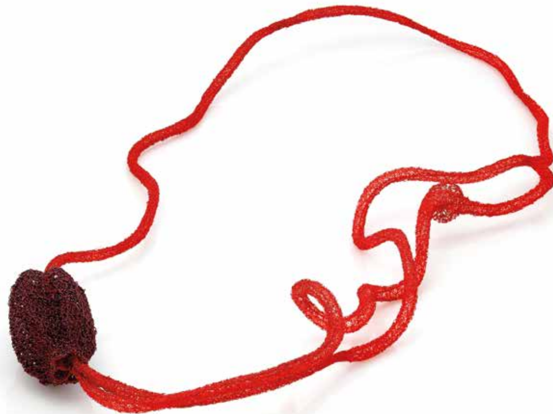
Parasitism / Symbiosis necklace, copper, silicon, steel, 2023