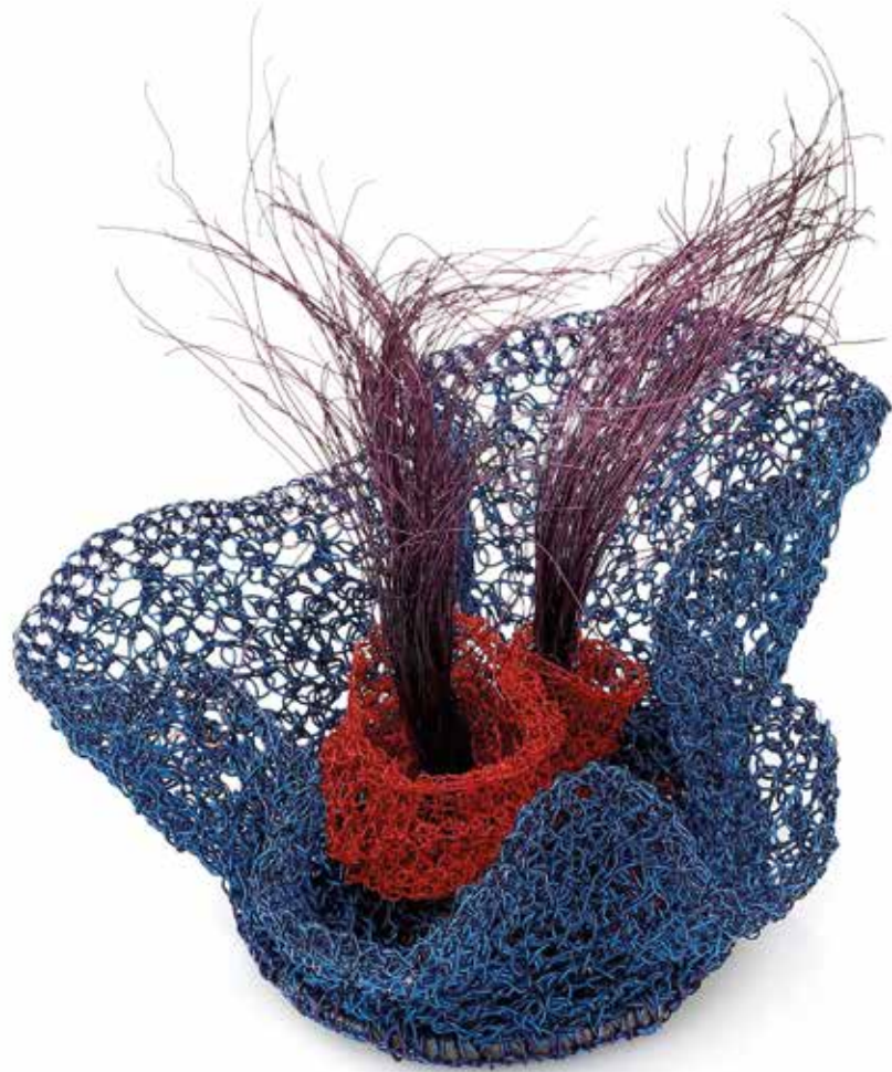
Fobia społeczna / Strefa komfortu brosza, miedź, srebro, stal, 2023