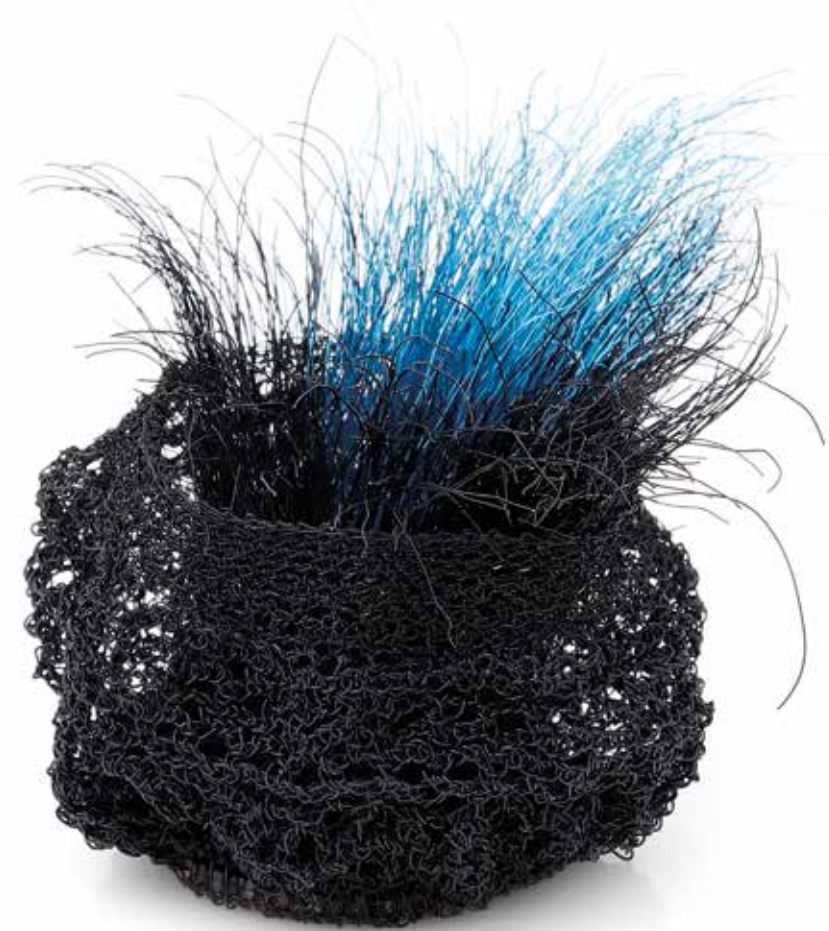
Social anxiety / Comfort zone brooch, copper, silver, steel, 2023