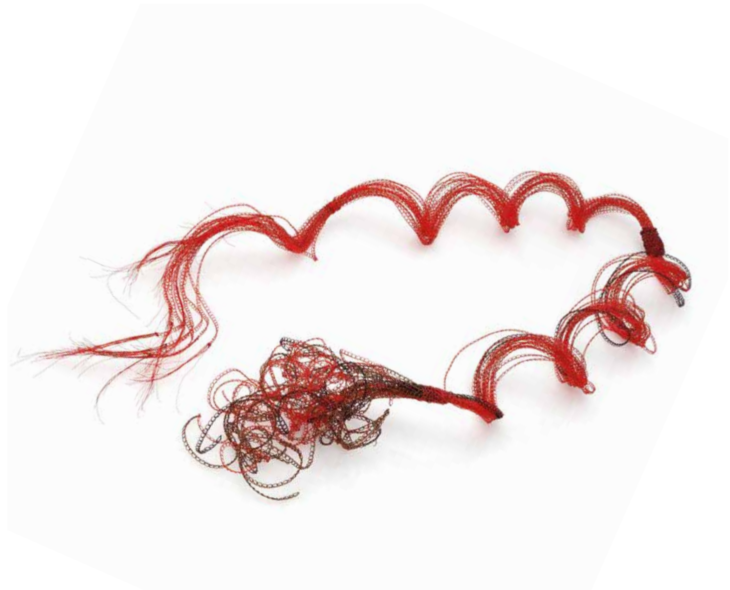
Broken ties – cowardice Broken ties – courage necklace, copper, 2023