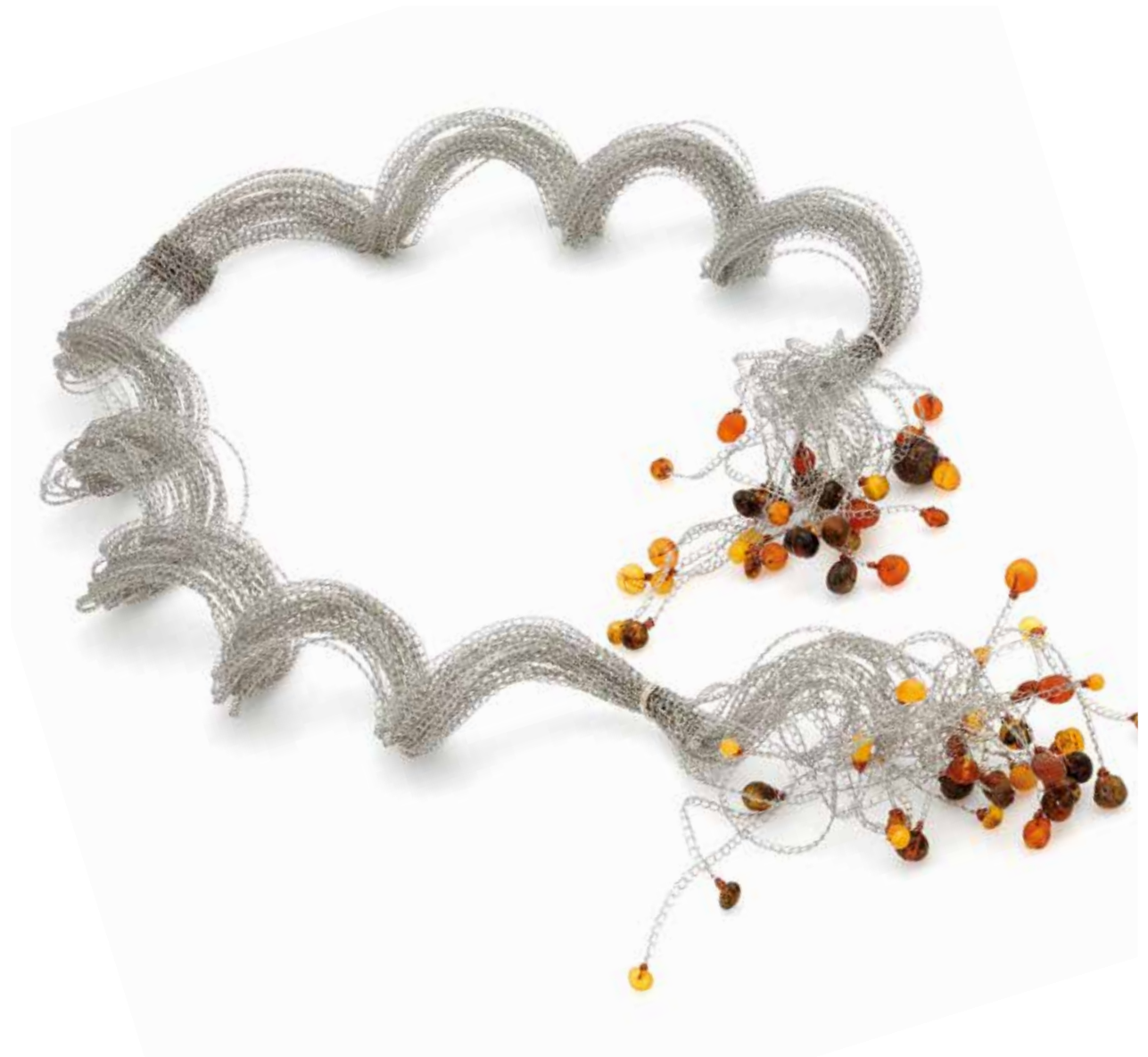
Zerwane więzi – tchórzostwo Zerwane więzi – odwaga naszyjnik, miedź posrebrzana, kulki bursztynu 3-4 mm, 2023