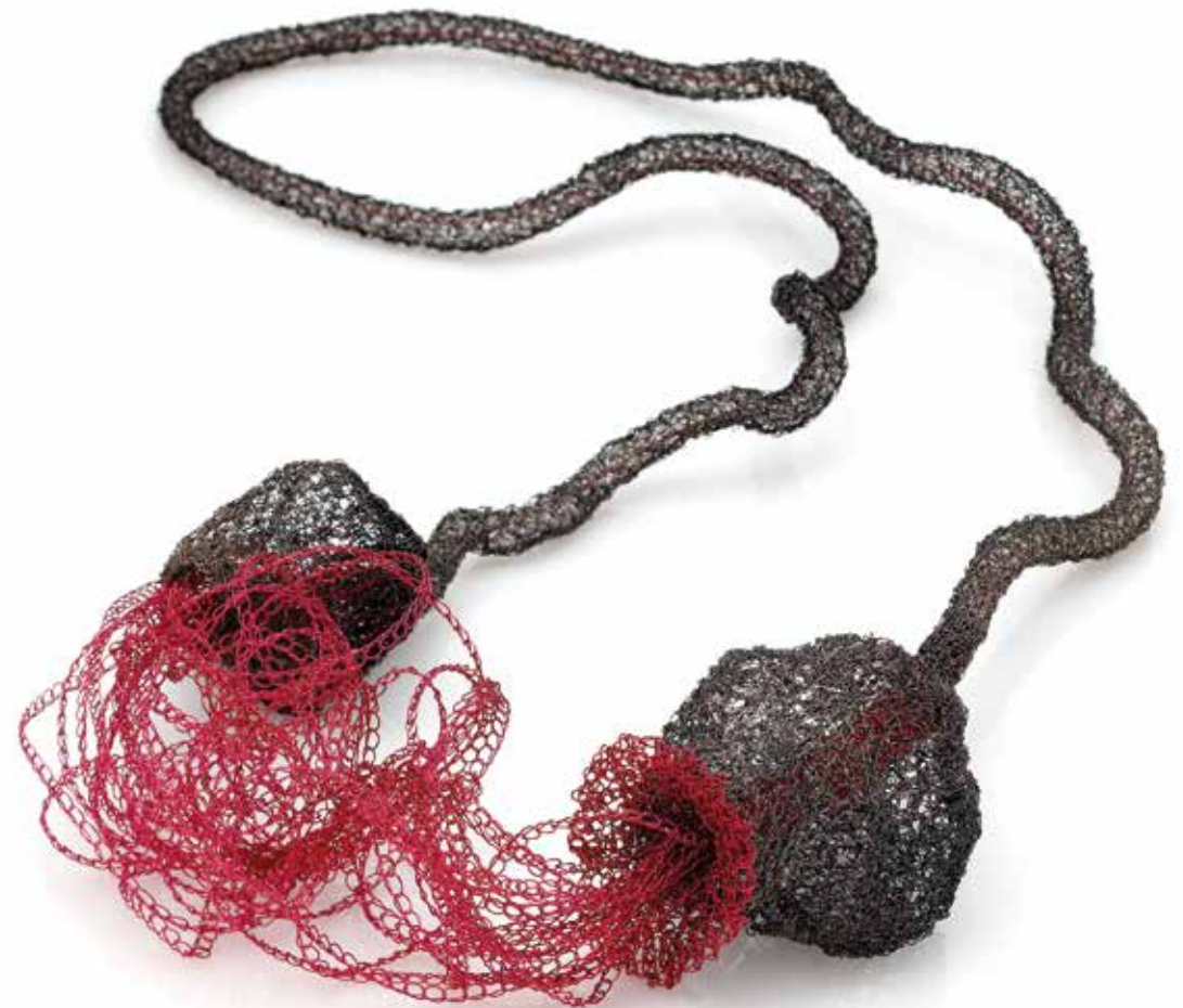
Lęk separacyjny Wierność, Oddanie naszyjnik, miedź, silikon, stal, 2023