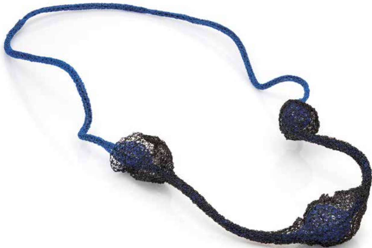
Lęk separacyjny Wierność, Oddanie naszyjnik, miedź, stal, 2023