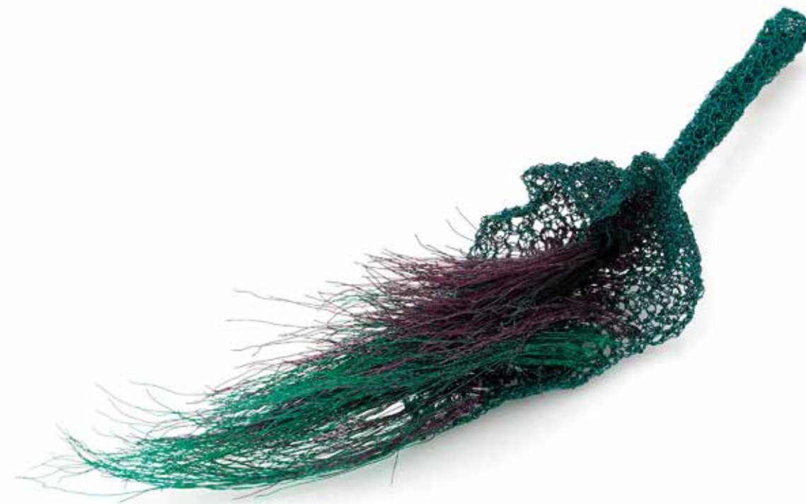
Mania / Creativity brooch, copper, silver, steel, 2023