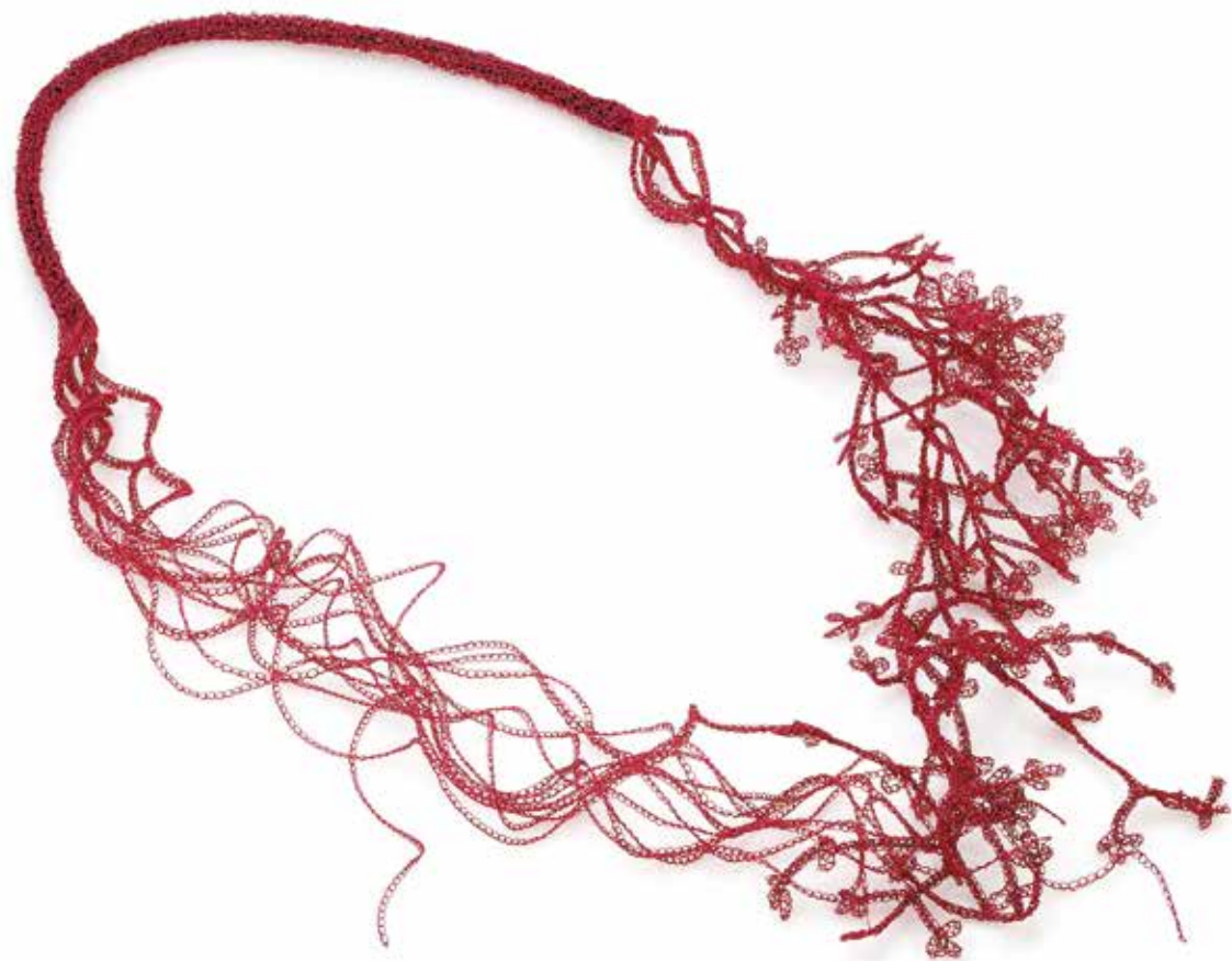
Zerwane więzi – tchórzostwo Zerwane więzi – odwaga naszyjnik, miedź, 2023