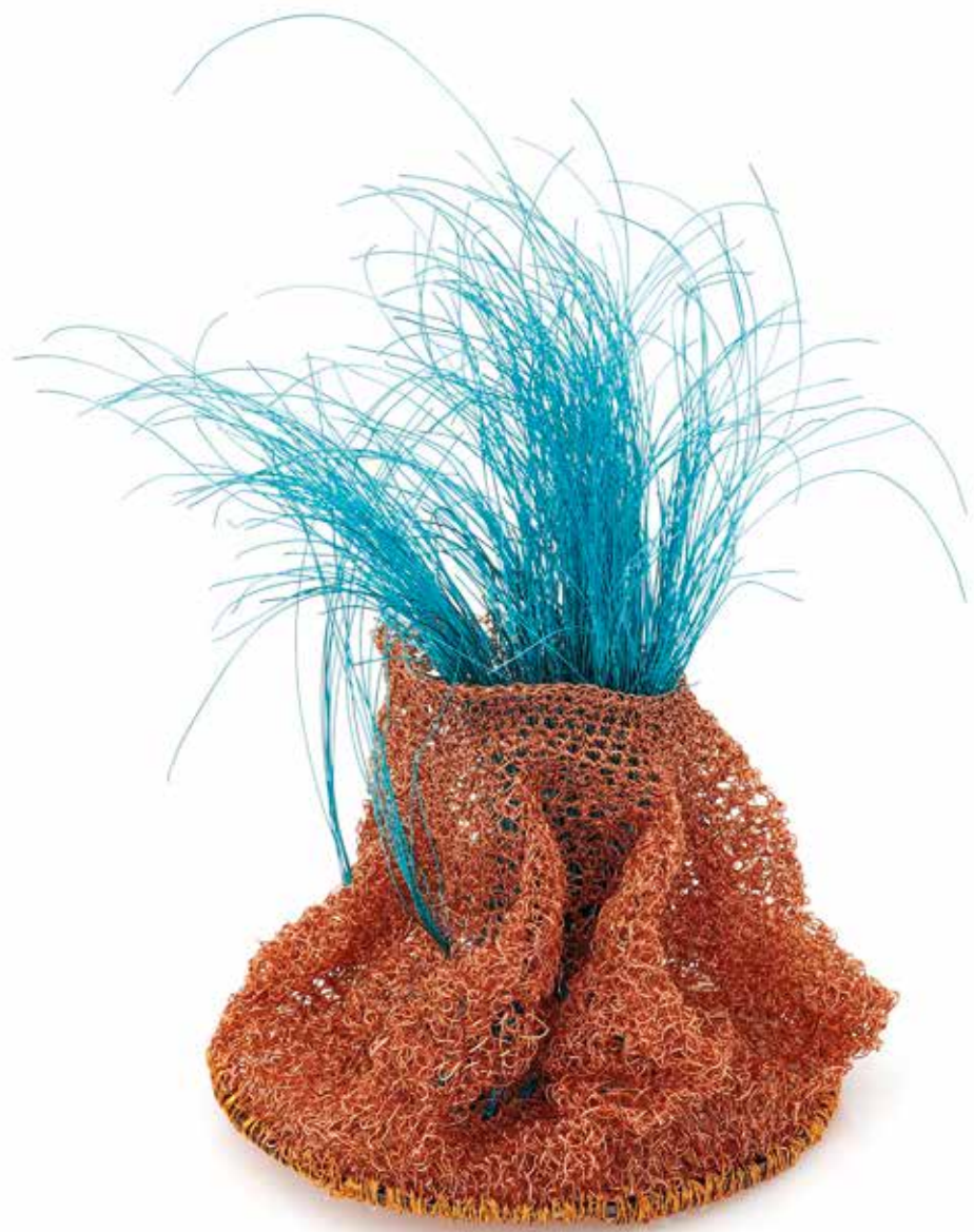
Klatka / Schron brosza, miedź, srebro, stal, 2023