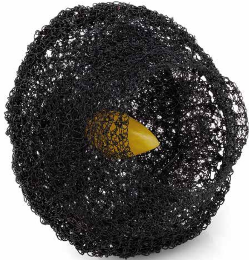
Fobia społeczna / Strefa komfortu brosza, miedź, srebro, stal, bursztyn, 2023