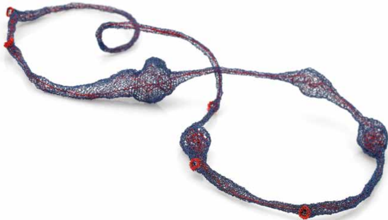
Pasożytnictwo / Symbioza naszyjnik, miedź, silikon, stal, 2023