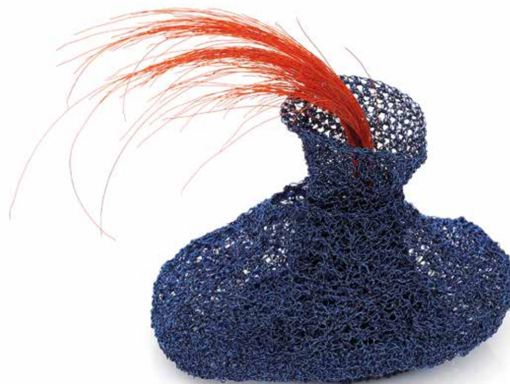
Cage / Shelter brooch, copper, silver, steel, 2023