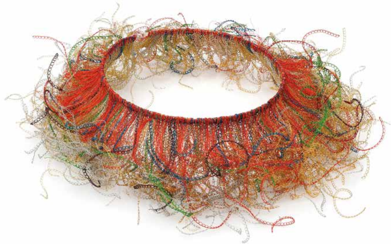
Mania / Kreatywność naszyjnik, miedź, srebro, 2023