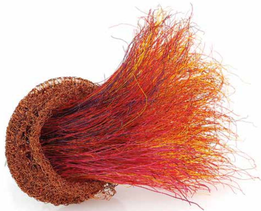
Mania / Kreatywność brosza, miedź, srebro, stal, 2023