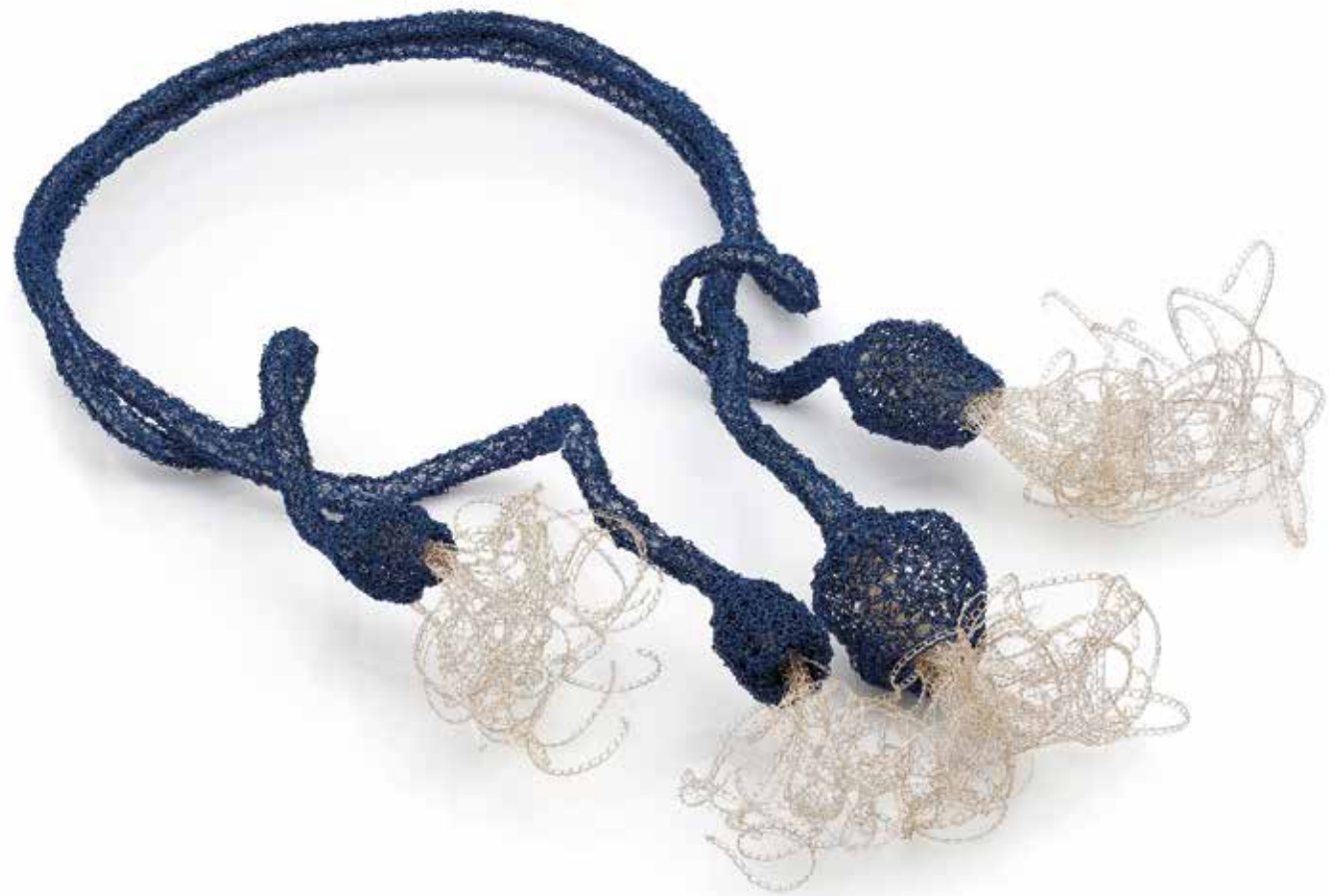
Lęk separacyjny Wierność, Oddanie naszyjnik, miedź, stal, 2023