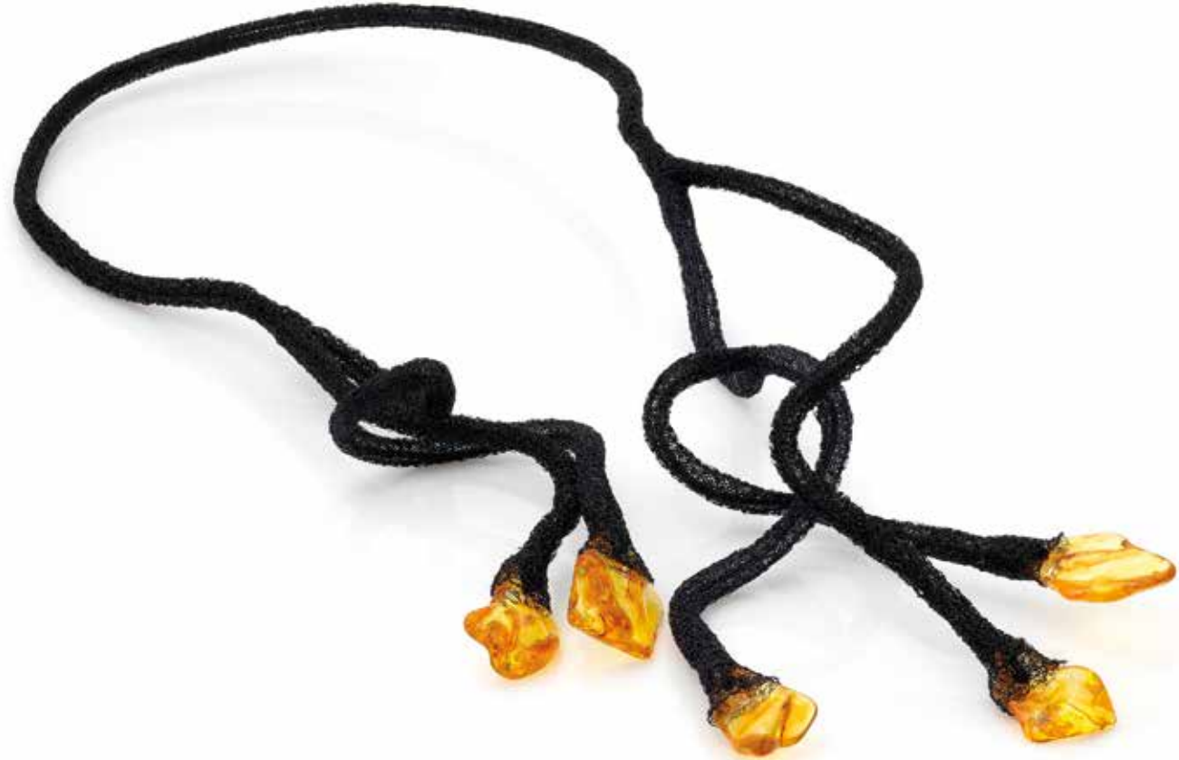
Lęk separacyjny Wierność, Oddanie naszyjnik, miedź, stal, bursztyn, 2023