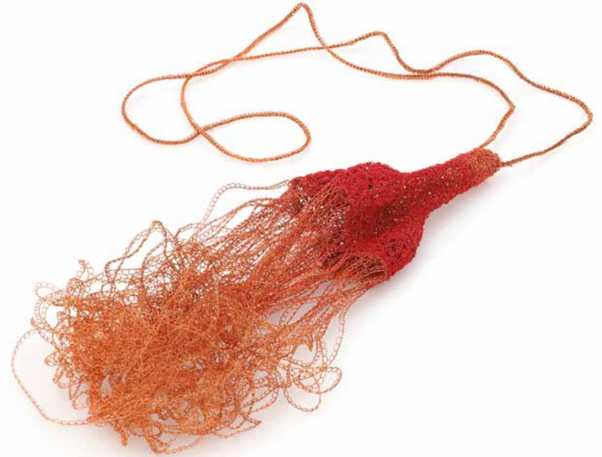
Lęk separacyjny Wierność, Oddanie naszyjnik, miedź, farba akrylowa, 2023