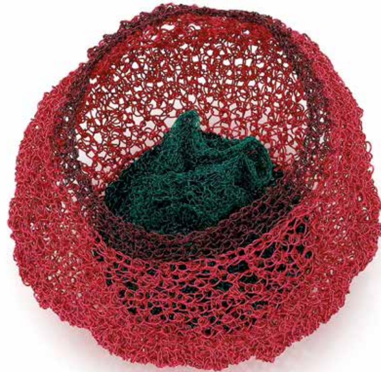
Fobia społeczna / Strefa komfortu brosza, miedź, srebro, stal, 2023