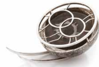
Pochodzenie brosza srebro, septaria, 40x23x60 mm, 2023