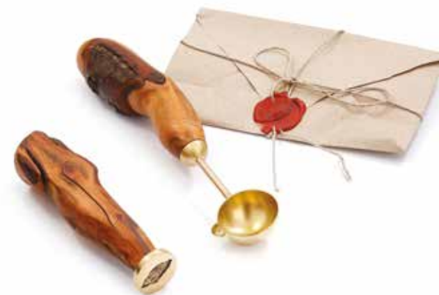
Obiady czwartkowe obiekty mosiądz, drewno śliwa, 115x30x30 mm (pieczęć), 200x40x30 mm (łyżka do laku), 2023