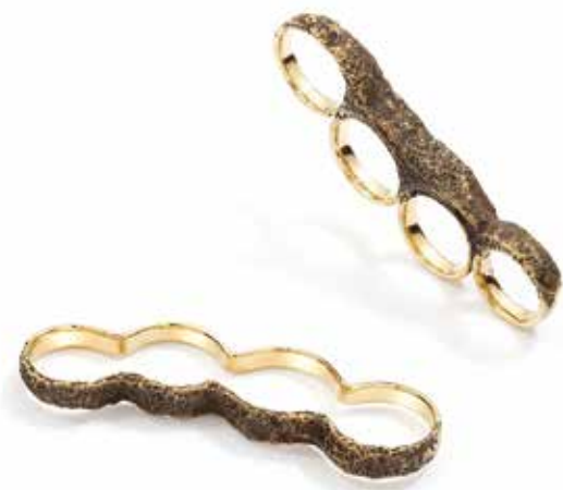
Neovintage kastety mosiądz, 90x30x10mm, 2023