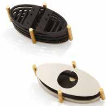
Mackintosh brosze alpaka, mosiądz, drewno hebanowe, 90x45x30 mm, 90x45x40 mm, 2022