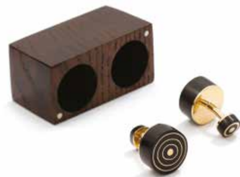
Orbita spinki do mankietów mosiądz, drewno hebanowe, drewno dąb wędzony, 20x20x26mm, 60x30x40 mm (pudełko), 2022