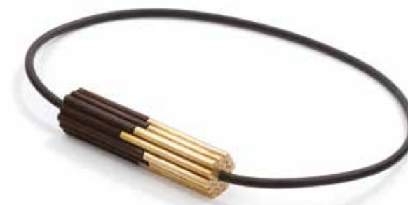
Zespojenie wisior mosiądz, drewno bukowe, bejca, rzemień kauczukowy, 21x170x170 mm, 2022