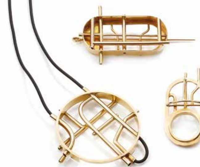
Autobusy brosza, wisior, pierścien mosiądz, rzemień kauczukowy, 90x50x20, 450x100x10, 60x30x20 mm, 2022