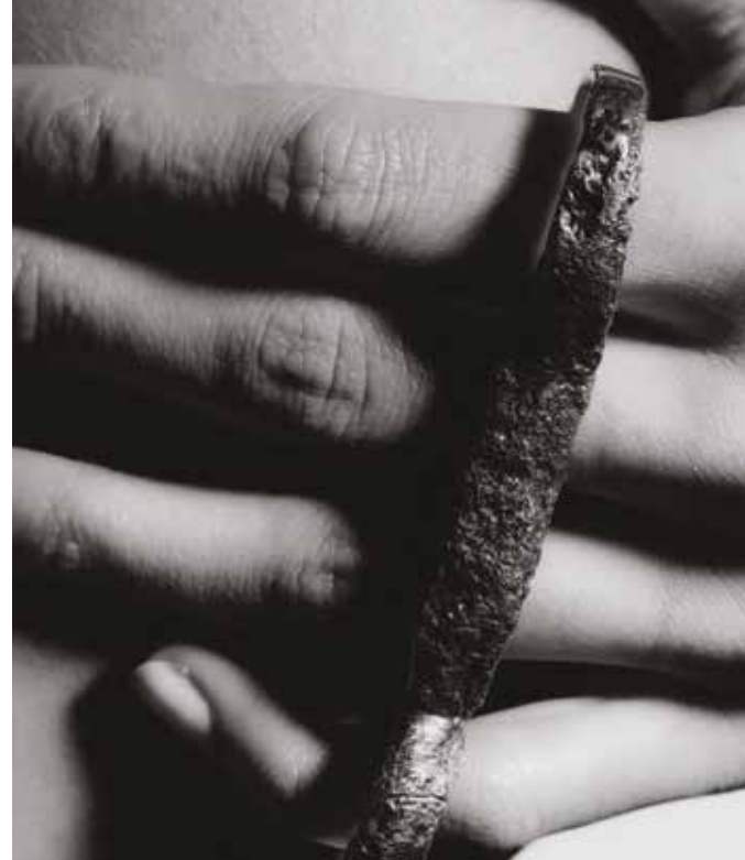
Mackintosh brooches alpaca, brass, ebony wood, 90x45x30 mm, 90x45x40 mm, 2022